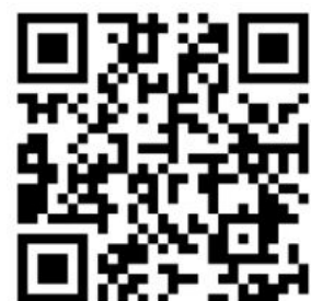
Ideenplattform, moderiert von GLP und PFH

Welche Ideen in der nächsten Projektküche diskutiert werden sollen, kannst du mitbestimmen. Vielleicht hast du eine eigene Idee? Reiche sie ein, kommentiere bereits aufgeschaltete Ideen und diskutiere mit in der nächsten Projektküche.