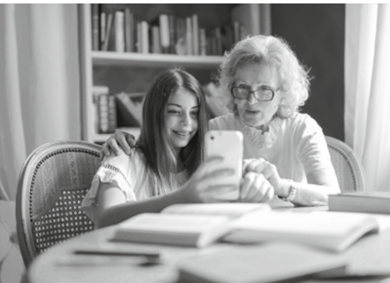
Unterstützung bei den Hausaufgaben und dafür Bedienungshilfe für Handy?

Weil sich die Diskussionsform in zwei Gruppen bei der ersten Projektküche bewährt hat, werden wir auch am 11. Juni ein zweites Thema zur gemeinsamen Erarbeitung auswählen. Wir freuen uns auf weitere Vorschläge und Ideen! Über unsere «Ideen-Plattform» können Sie Abstimmen, welches Thema zusätzlich diskutiert werden soll.