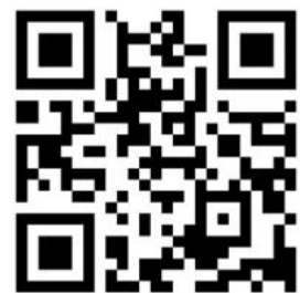
Bedarfsumfrage Carsharing in Hettlingen

Nach den Präsentationen setzen sich die Teilnehmenden zusammen, um mögliche weitere Schritte zu planen. Mit viel Motivation werden Pläne geschmiedet, wie die Projekte weiter vorangetrieben werden können. Die Idee des Vitaparcours könnte im Mitmachzelt von GLP, PFH und IG Pro*Hettlingen an der Hettlinger Dorfet 2024 vorgestellt werden, und eine Umfrage zum Bedarf an Carsharing wird als sinnvoller Schritt definiert. Ein konkretes Carsharing-Angebot kann schon sehr bald aufgelegt werden, sofern das Interesse gemäss der Umfrage genügend gross ist. Die technischen und rechtlichen Herausforderungen konnten im Nachgang der Projektküche bereits mehrheitlich geklärt werden.