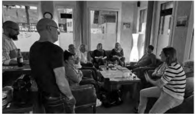
Teilnehmer der Projektküche in der Whisky Lounge

Daneben wurde auch der Wunsch nach einem physischen Treffpunkt für alle Generationen geäussert. Ein zentraler