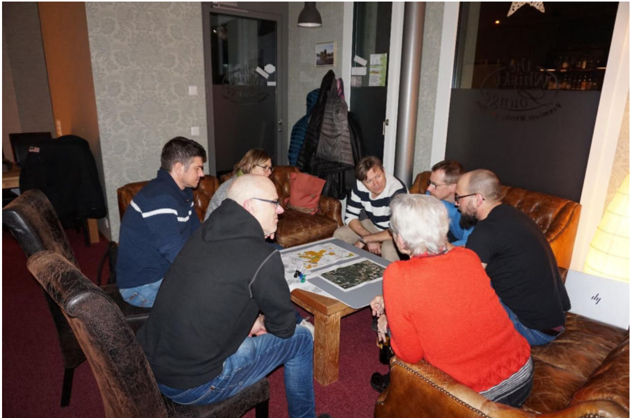
Angeregte Diskussion zum Thema Vitaparcours in Hettlingen

In der gemütlichen Atmosphäre der Whisky Lounge treffen sich am Abend des 12. März 2024 mehr als ein Dutzend unterschiedliche Menschen aus Hettlingen, um an zwei bemerkenswerten Projekten zu arbeiten: dem Bau eines Vitaparcours und der Einrichtung eines Carsharings. Die Teilnehmenden, vom jungen Familienvater bis zur aktiven Rentnerin, vom professionellen Autovermieter bis zur Nachbarin, die sich ein Auto ausleihen möchte, bilden eine beeindruckende Vielfalt.