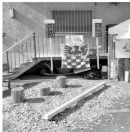
Vitaparcours- Posten an der Dorfet Hettlingen.

Am selben Abend wurde auch die Idee eines digitalen Dorfplatzes von einer zweiten Gruppe weiterverfolgt. Diese Idee ist bereits einige Monate alt und wurde sowohl bei einer Sitzung der Dorfvereinigung (dem Treffen aller Hettlinger Vereine) als auch im Gemeinderat diskutiert. Das Projekt geriet jedoch ins Stocken, da die ursprünglich geplante Plattform hohe Kosten verursacht hätte und die Moderation zusätzliche Ressourcen erfordert hätte.